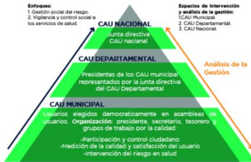
Grafica 3.3.1. Modelo Institucional de Participación Social

Ecoopsos EPS SAS, garantiza y promueve el derecho a la participación social con un modelo estructurado, conforme a la Política de Participación Social en salud, adoptada por el Ministerio de Salud y Protección Social con la Resolución 2063 de 2017. Conforme a los lineamientos estratégicos y normativos que orientan el desarrollo de las actividades de ECOOPSOS EPS SAS informamos que Ecoopsos EPS SAS, cuenta con el Modelo Institucional de Participación Social en Salud, empoderando a los líderes sociales, vinculados a los Comités Alianza de Usuarios (CAU) para ejercer vigilancia sobre la forma y a las condiciones en las que la entidad y demás actores organizan y prestan los servicios que reciben, controlando la gestión de la EPS, la red de prestadores y el Ente territorial.